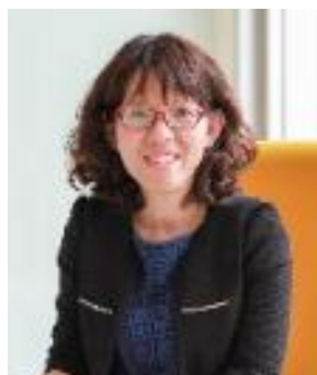
Giang Bảo Châu