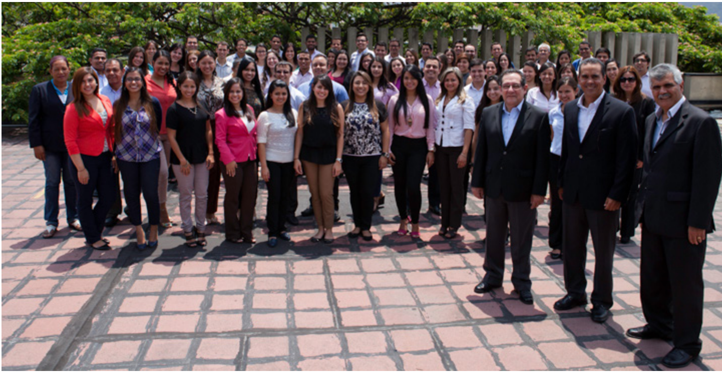
80 años de pasión

“La región representa todo un potencial. Desde aquí atendemos los estados Monagas, Anzoátegui y Guárico. El petróleo, nuestro petróleo está allí, sigue siendo un factor determinante. Es el factor para afrontar el desarrollo. Con una nueva expansión, similar a la de la década de los 90, vemos una gran concurrencia de capital humano altamente profesionalizado y esto inevitablemente impactará otras áreas de la economía, específicamente la construcción, el turismo y los servicios. Así como ayer estuvimos y hoy representamos un valioso aporte a toda la región, mañana estaremos con el mejor y más capacitado equipo de profesionales. Apostamos y confiamos en la naturaleza demandante de nuestra industria petrolera.”