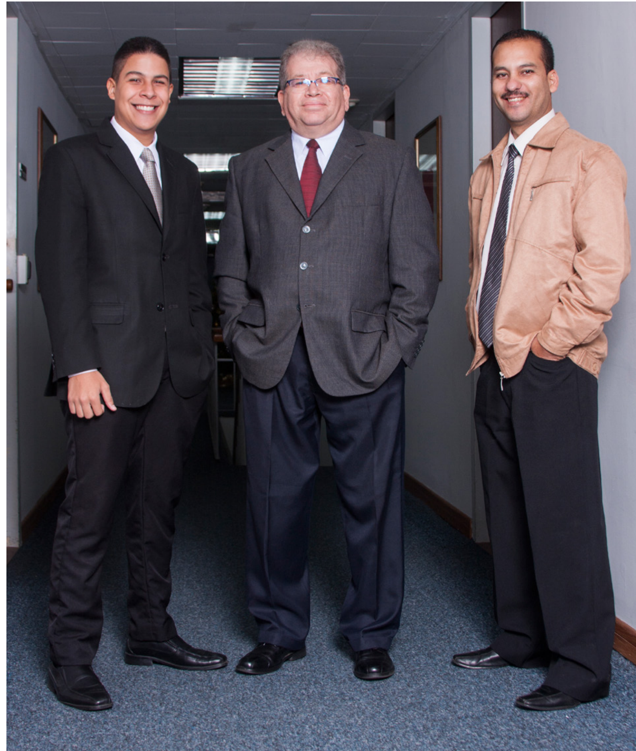
Equipo de Seguridad de la Información

haciendo énfasis que en la Firma maneja información confidencial y que un manejo indebido de ella puede provocar incidentes graves, a nivel económico o de reputación para el cliente o para la Firma. Por ello, todos nuestros colaboradores desde la persona que atiende en la recepción, hasta el socio con mayor antigüedad o representatividad, terminan conociendo aspectos de la cultura de la información.