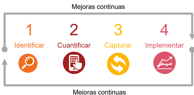
Figura N° 2

Figura N° 1: