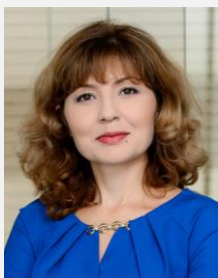
Лейла Ник-Заде Менеджер практики внутреннего аудита

T: +7 (727) 330 32 00 E: elmira.stamkulova@kz.pwc.com