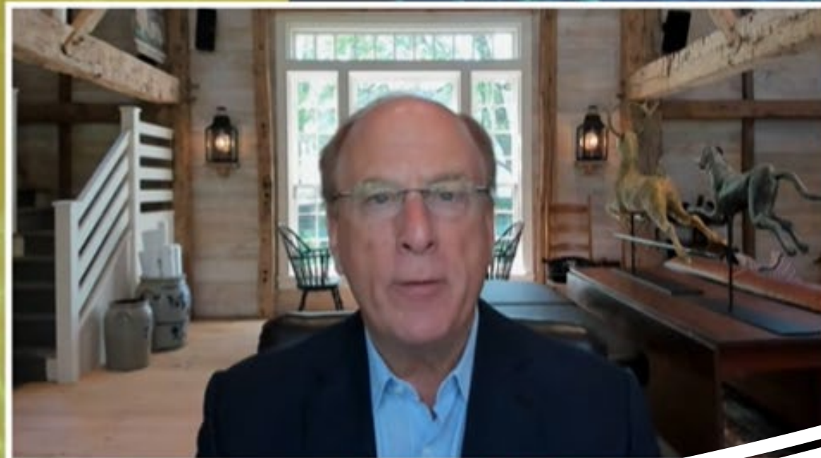
Larry Fink, CEO Blackrock