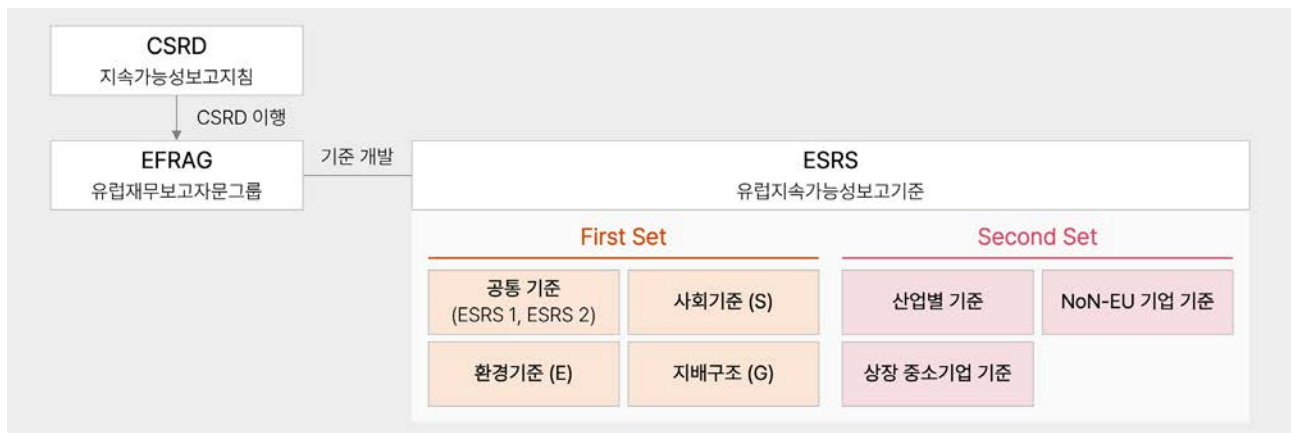
[표4] ESRS(EU Sustainability Reporting Standards) First set 기본 구성