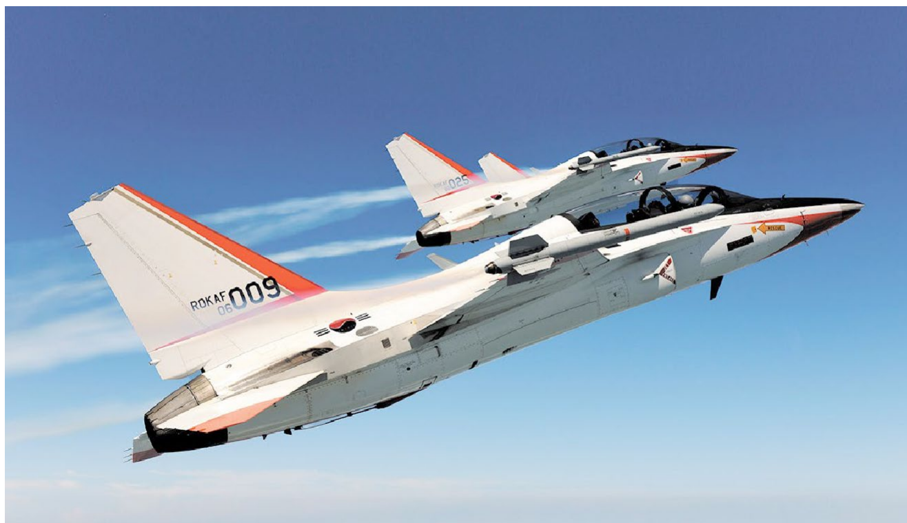
출처: 한국항공우주산업(주) T-50 Golden Eagle

출처: PwC analysis (* bps = basis points; 1 basis point = 0.01%)