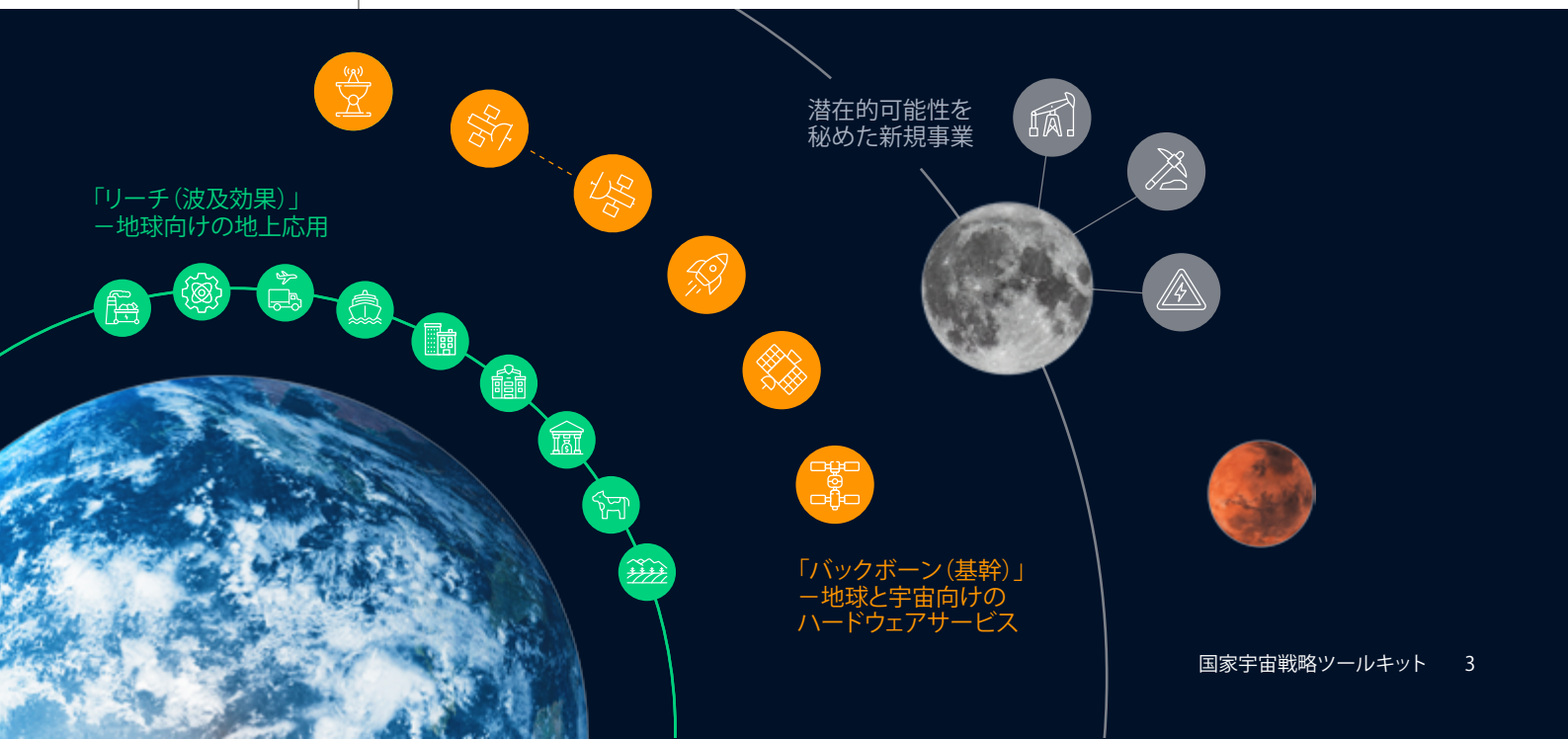
図1 スペースエコノミーの概要

④ 宇宙はグローバル経済にとって不可欠な要素であり、ほぼすべての産業分野に影響を与えている。宇宙開発は、地上の各産業分野における直接的な価値の1.8倍から3.2倍に相当する波及収益を生み出す可能性がある。