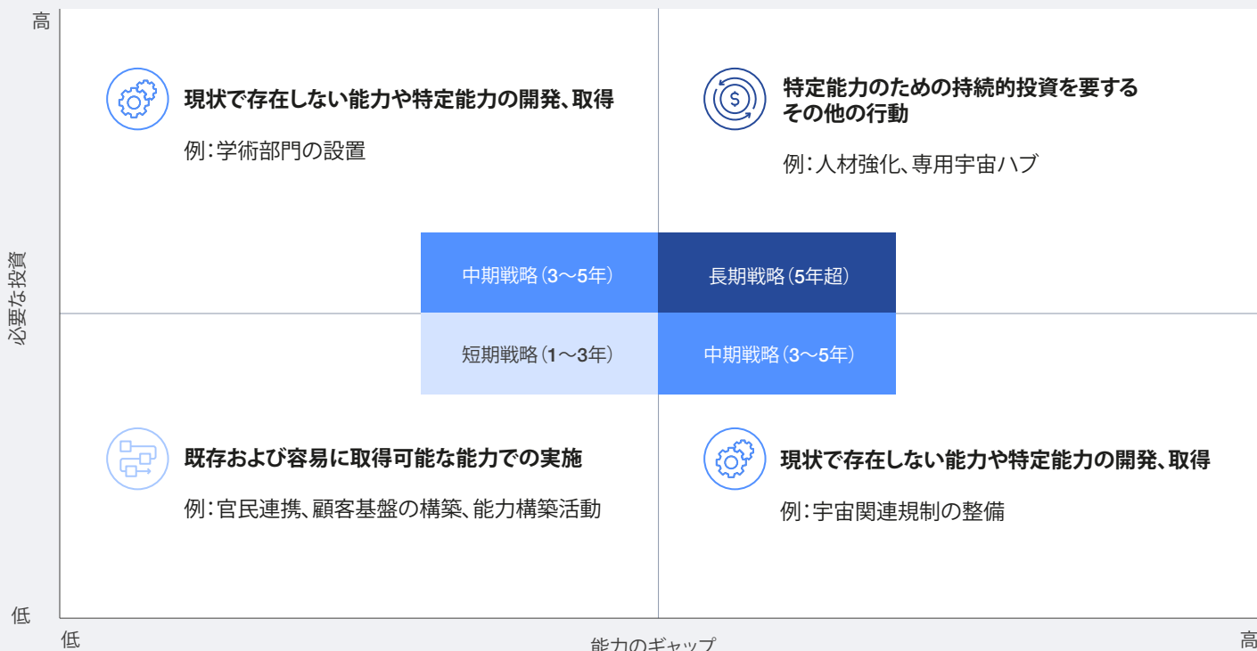
図 4 行動の優先順位付けを行うためのロードマップ

④ KPIと同時に、主要な行動のタイムフレームを明示した明確なマイルストーンを設定し、進捗を評価する必要があります。定期的なレビューを実施し、進捗、変化、新たな機会に基づき優先順位を見直す。