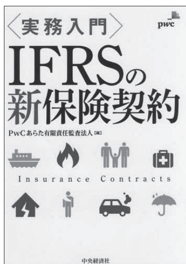
書名：実務入門 IFRSの新保険契約 出版社：中央経済社 編者：PwCあらた有限責任監査法人 定価：3,800円(税抜き) 発行月：2017年10月

国際会計基準審議会（IASB）により、およそ20年間の検討の成果として、2017年5月にIFRS第17号「保険契約」が公表されました。「保険契約」という基準の名称が表すとおり、IFRS第17号は、保険会社だけに適用される基準ではありません。契約の内容がIFRS第17号に定める保険契約の定義に該当する場合には、全ての企業が発行した契約についてIFRS第17号を適用することが求められます。