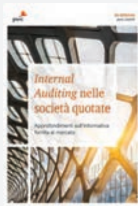
Internal Auditing - Indagine nelle società quotate