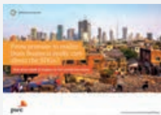
SDG reporting challenge