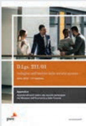
D. Lgs. 231/01 - Indagine nell'ambito delle società quotate