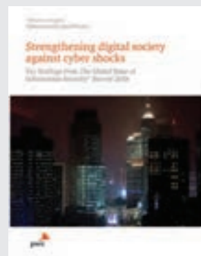
Global State of Information Security Survey - Cyber