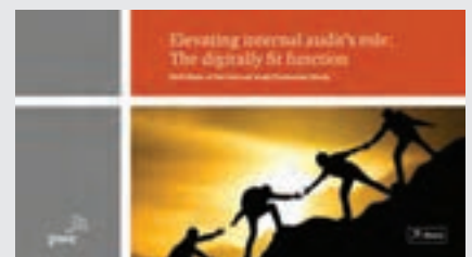
State of the Internal Audit Study