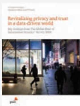
Global State of Information Security Survey - Privacy and Data