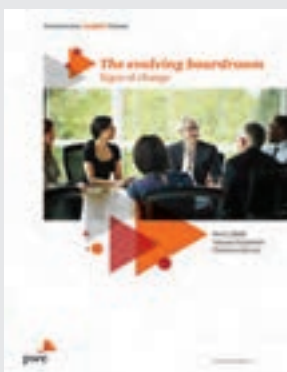
Corporate Directors Survey