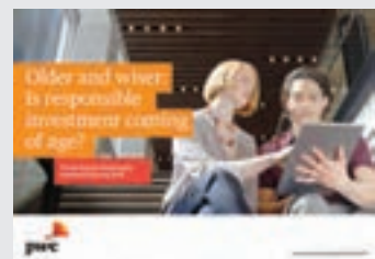
Private Equity Responsible Investment Survey