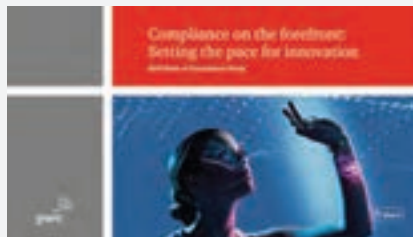
State of Compliance