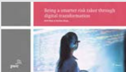
Risk in review