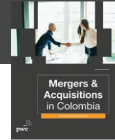
Fusiones y Adquisiciones