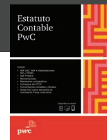
Estatuto Contable PwC, físico y virtual.