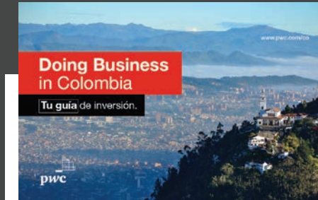
Doing Business in Colombia.