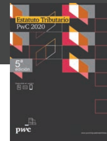
Estatuto Tributario PwC, físico y virtual.