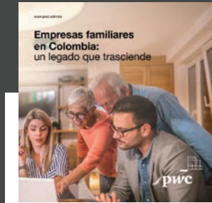
Empresas familiares en Colombia.