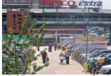
Supermercado Tesco Seacoft Shopping Center

Para una gran cadena de Supermercados Minorista se realizó revisión y análisis de los costos históricos de construcción de la Compañía; considerando las tendencias en el gasto. Adicionalmente, se realizó un ejercicio de benchmarking para determinar las áreas específicas donde los costos registrados eran superiores a los de la competencia.