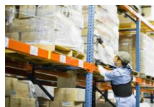
Empresa de Retail Venta de Productos de Catálogo online

Asesoría para realizar un análisis del impacto empresarial y Gestión de Crisis. Adicionalmente se desarrolló un ejercicio de simulación de crisis para ensayar los supuestos de la prueba, confirmar los objetivos de tiempo de recuperación e identificar acciones de implementación.