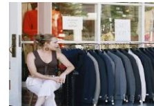
Empresa Japonesa Líder en Ventas Ropa Juvenil

Para empresa Japonesa de retail, líder en ventas de ropa juvenil se llevó a cabo un análisis detallado de la economía retail en el segmento de ropa juvenil y un benchmarking competitivo de los competidores internacionales claves.