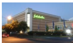
Tienda Falabella Retail Mall Alto Las Condes Santiago

Valorización de Activo Fijo Inmovilizado, incluidos terrenos y construcciones de las Empresas del Holding Falabella S.A.C.I. bajo Norma Financiera Europea I.F.R.S. Se determina valor justo de 368 inmuebles en Chile, Argentina, Perú y Colombia.