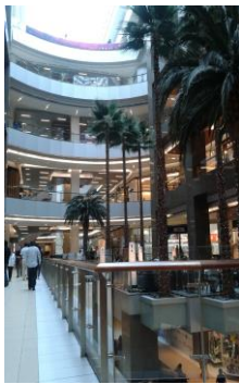
Mall Costanera Center Providencia

Los servicios abordados durante la ejecución de la Obra Gruesa e Instalaciones del proyecto Costanera Center, incluyeron: