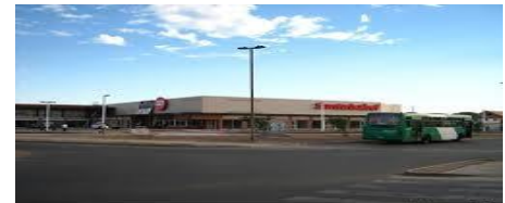
StripCenter Santa María de Maipú La Farfana - Maipú

Los servicios entregados durante la ejecución del proyecto incluyeron: