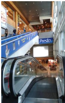
Supermercado HiperLider Los Cobres de Vitacura

Valorización de Activo Fijo Inmovilizado de la empresa D&S por Norma Financiera Europea IFRS, como parte del traspaso de la propiedad a Walmart