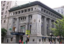
Birks Store Vancouver, Canadá

Para la principal empresa de Retail, se gestionó la programación y puesta en servicio de plataforma tecnológica del tipo Business Inteligence, orientada a una administración eficiente de bienes raíces, implementando un conjunto de herramientas para identificar las oportunidades de reducción de costos a través del portafolio de proyectos. Adicionalmente, se entregó directrices Al equipo de ejecutivos encargados de la administración y gestión de bienes raíces a 5 años plazo.