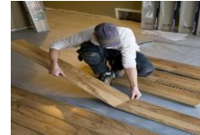
Empresa Textil de la India

Servicio para comprender el mercado global de soluciones de suelos junto con el análisis de segmento, análisis de entorno de retail y el análisis de la intensidad competitiva.