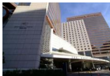
Continental Shopping Center Sao Paulo, Brasil

Auditoría de contrato de obras, incluida asesoría en la validación de controles de gestión de costos en emprendimiento de remodelación de Centro Comercial y Núcleo Empresarial para Jones Lang La Salle en su calidad de inversor inmobiliario.