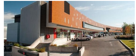
Centro Comercial Paseo Los Dominicos, Las Condes

El proyecto ubicado en San Carlos de Apoquindo incluye Locales Comerciales, Supermercado Jumbo, 7 Salas de Cine y Estacionamientos Subterráneos.