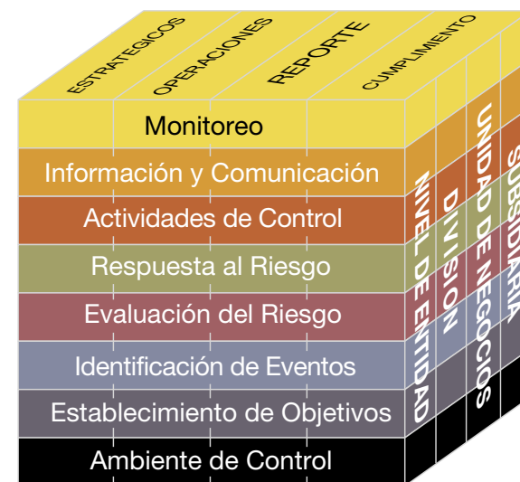
Figura 1. COSO II - ERM: Marco de Gestión Integral de Riesgo

El éxito de una GIR se fundamenta en desarrollar y mantener un adecuado Ambiente de Control, este boletín tiene como finalidad profundizar en el primer componente COSO II – ERM: Marco de Gestión Integral de Riesgo, como base de todos los demás componentes de la GIR.