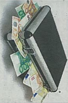
ychádzať každú stredu