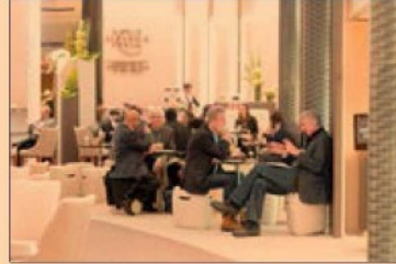
Se estima que hay más de 3,000 invitados especiales a Davos.