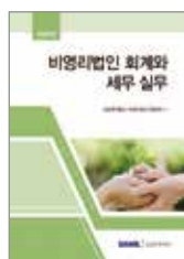
비영리법인 회계와 세무 실무

15년 이상 축적된 전문 지식과 실무 경험을 집필하여 비영리업계와 전문가에게 베스트셀러이자 스테디셀러로서 수년간 자리매김하고 있습니다.