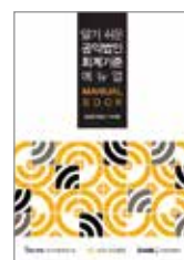
알기 쉬운 공익법인 회계기준 매뉴얼