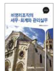
비영리조직의 세무회계와 관리실무