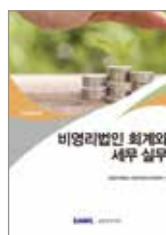
비영리법인 회계와 세무 실무